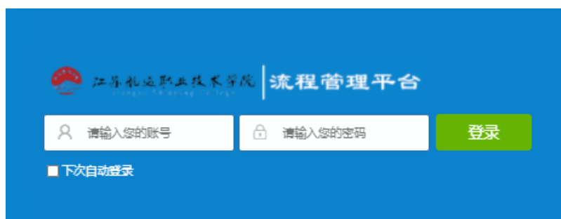
图 2 登录页面